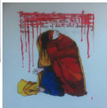
Jorge Luis Borges

"...La nuit nous dicte sa tâche magique. Détisser les mailles de l'univers, les ramifications inépuisables des effets et des causes, qui se perdent dans ce vertige insondable – le temps. la nuit exige que cette nuit même, tu oublies ton nom, ton sang, tes ancêtres, chaque parole humaine et chaque larme,